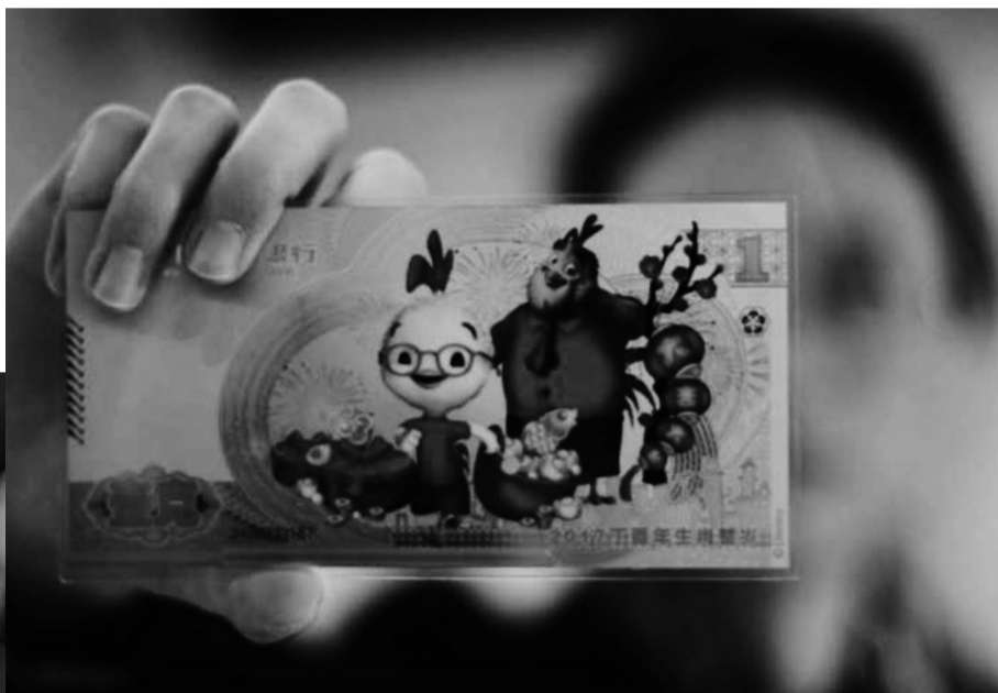
本报讯(通讯员 孙宇)中国建设银行为迎接农历鸡年的到来,于近日发行精美的压岁钞和纪念币,受到广大市民热捧,因而争相预定。