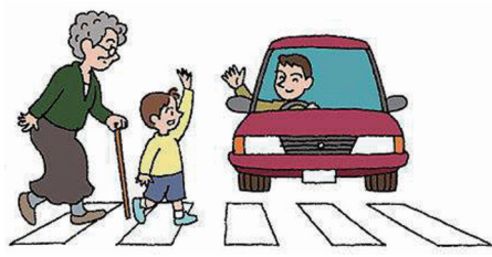
才是道路交通行为主体正确的打开方式。

斑马线源于古罗马时代的跳石，用于分隔人行道和车行道，缓解交通堵塞，方便行人通过。20世纪50年代初期，英国人设计出了一种横格状的人行横道线，看上去像斑马身上的白条纹，被称为斑马线。司机驾驶汽车看到斑马线会自动减速缓行或停下，让行人安全通过，斑马线由此沿用至今。