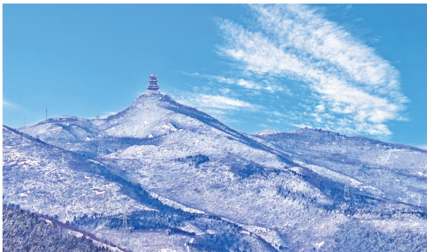
雨后初晴的门头沟，仿佛身披婚纱缓缓走来的新娘，在阳光、蓝天、白云的映照下，柔婉而清丽，娇俏而动人。