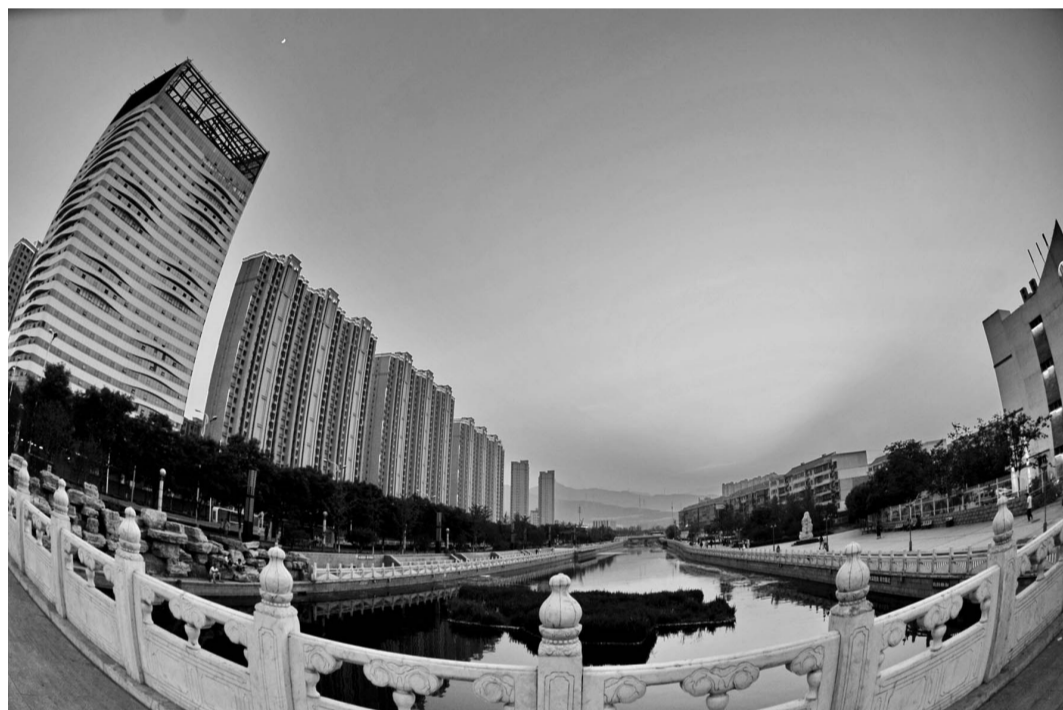
石龙经济开发区