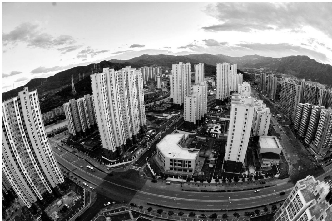
棚改安置房黑山地块